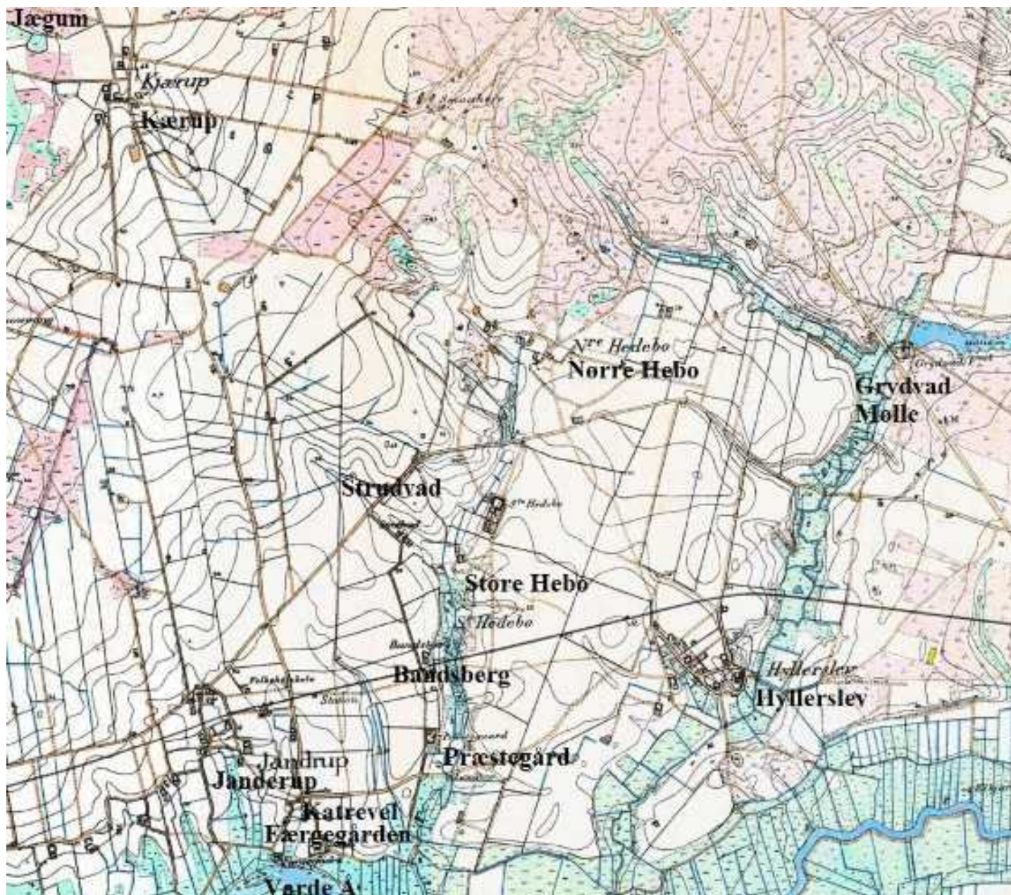
Janderup sogn. Familie 1 - 98