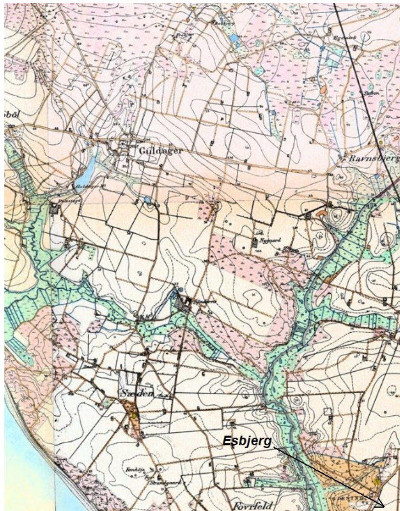
Oversigtskort ca. år 1900 over området.