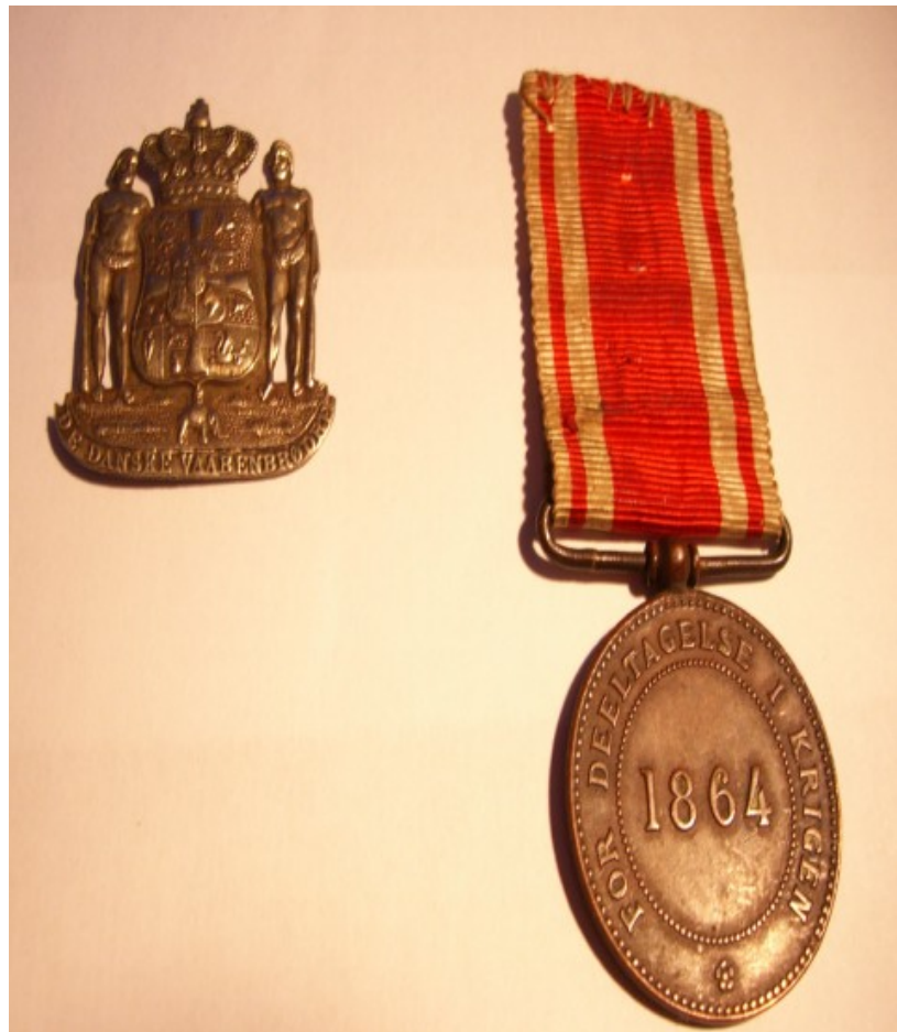
De Danske Vaabenbrødre. Fortjenstmedalje for Krigen 1864. Desuden var han Dannebrogsmænd.